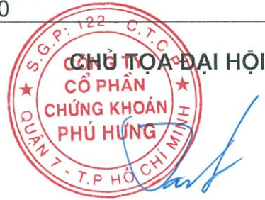
Ông CHEN CHIA KEN